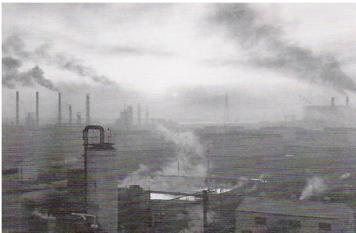
図2. 四日市コンビナート (1960年代)

20世紀後半の大きな環境問題は、重化学工業による大気汚染と化学工業による重金属汚染です。とくに有名なのは熊本県の水俣で発生した「水俣病」で、チッソ水俣工場から海域に排出されたメチル水銀が食物連鎖を通じて住民に摂取され、深