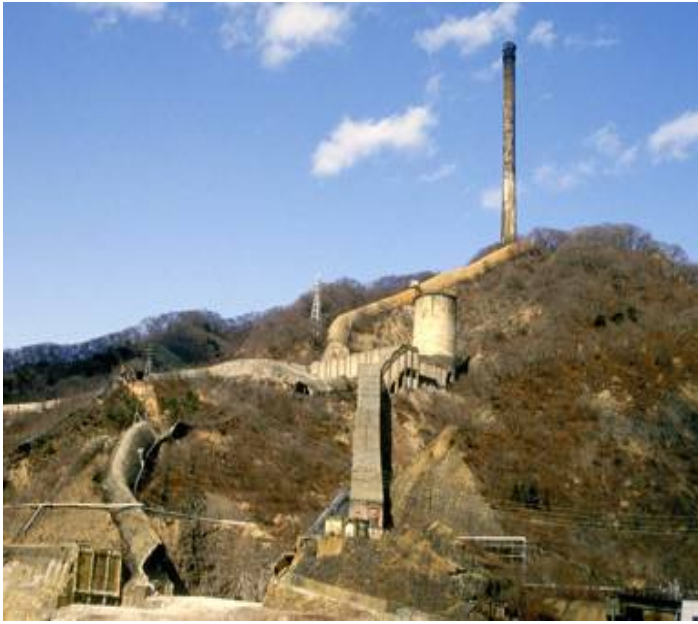
図1. 日立鉱山の百足煙道と煙突