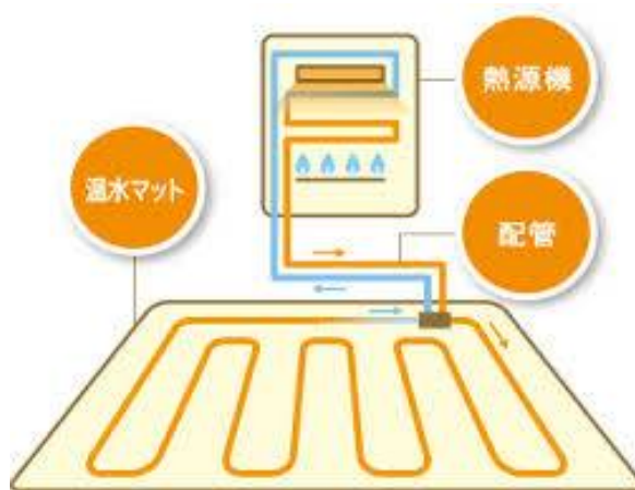
図 2. ガスを熱源とする床暖房

ーリングへ張り替えが必要で、各メーカーは床暖房に適したフローリングを販売しています。ガス給湯器 (熱源機) はキッチンや浴室用と共用できますが、給湯配管工事が必要です。給湯器を専用に設置する場合も、室外の設置場所まで水道とガスの供給配管が必要です。床暖房のエネルギー効率は給湯器に依存するので通常は 80%、潜熱回収型 (エコジョーズ) なら 95%に達します。設備費は、給湯器を含めると電気を熱源とする床暖房より高くなります。しかし燃料費は電気式より安いので、使用期間が長い寒冷地向きでしょう。