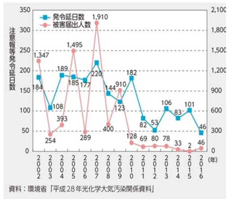
図1. 光化学オキシダントの注意報発令日数

光化学オキシダントは、大気中の硝酸塩や硫酸塩などの微粒子や浮遊粒子物質と結合し、光化学スモッグを形成します。光化学スモッグが初めて発生したのは1940年代のロスアンゼルスで、1943年には昼