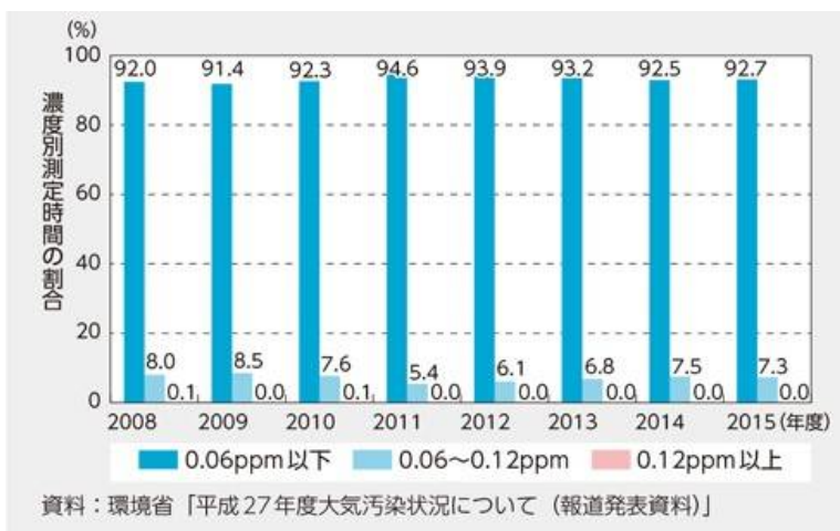
図 3. 昼間の光化学オキシダント濃度別測定時間の割合

の屋上や学校の校庭などに設けられた大気汚染モニタリング施設です。自排局は主に自動車の排ガスを対象としたモニタリング施設で、道路沿いに設置されています。図 3 に昼間に測定された濃度別時間の割合を示しますが、1 時間値が 0.06ppm 以下の割合は 92.7%（一般局）でした。したがって最高値は環境基準を達成できていませんが、9割以上の時間帯で環境基準が達成されています。