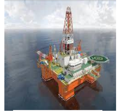
図 3. 海上掘削リグ