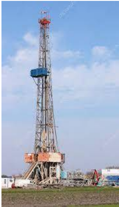
図 2. 地上掘削リグ

入して、回転させながら掘下げていきます。通常、油層に達するまでに多数の掘削パイプを繋いでいきます。掘削が終了したら、生産井にするための強化工事を行い、連続的な生産に移行します（図 2）。海上の場合も原理的には同じですが、海底の掘削になるので鉄骨のプラットフォームを海上に設置します。海上の設備になるので、波浪に耐えられる基礎工事や作業環境を整える必要性があり、大掛かりな設備になります。もちろん、それに見合うだけの生産量も必要です（図 3）。なお、油層の圧力は原油の生産量が増えるにつれて徐々に低下するので、油井に海水や原油に随伴して排出される低沸点の炭化水素を注入し、生産を続けるのが一般的です。油層の圧力が低い場合は自噴しないので、陸上の場合には図 4 のような採掘設備を設置し、モーター駆動のポンプで汲み出します。この方法は 100 年以上も前から採用されており、小規模な油井に多く、数十メートルを隔てて何百基も林立している油田地域が