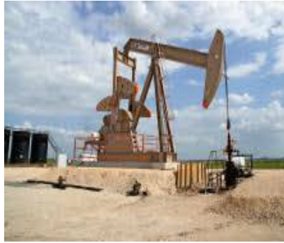
図 4. 汲み出しポンプ施設

入して、回転させながら掘下げていきます。通常、油層に達するまでに多数の掘削パイプを繋いでいきます。掘削が終了したら、生産井にするための強化工事を行い、連続的な生産に移行します（図 2）。海上の場合も原理的には同じですが、海底の掘削になるので鉄骨のプラットフォームを海上に設置します。海上の設備になるので、波浪に耐えられる基礎工事や作業環境を整える必要性があり、大掛かりな設備になります。もちろん、それに見合うだけの生産量も必要です（図 3）。なお、油層の圧力は原油の生産量が増えるにつれて徐々に低下するので、油井に海水や原油に随伴して排出される低沸点の炭化水素を注入し、生産を続けるのが一般的です。油層の圧力が低い場合は自噴しないので、陸上の場合には図 4 のような採掘設備を設置し、モーター駆動のポンプで汲み出します。この方法は 100 年以上も前から採用されており、小規模な油井に多く、数十メートルを隔てて何百基も林立している油田地域が